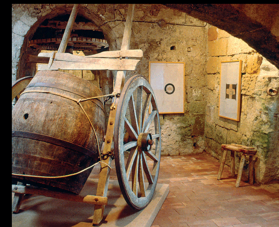
Museo del Sale - Salzmuseum