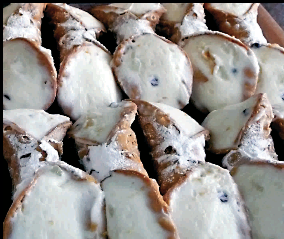
Cannoli di Dattilo - Cannoli aus Dattilo