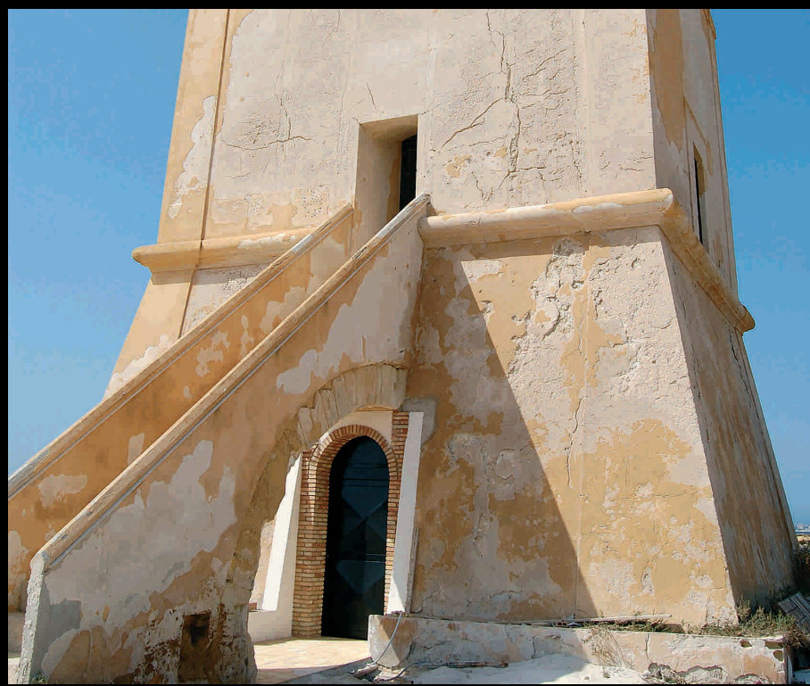
Nubia, Torre - Nubia, Turm