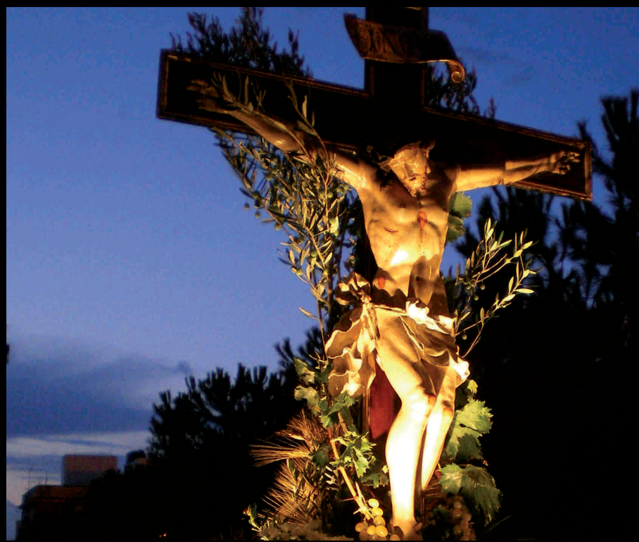
Processione SS Crocifisso - Prozession SS. Crocifisso