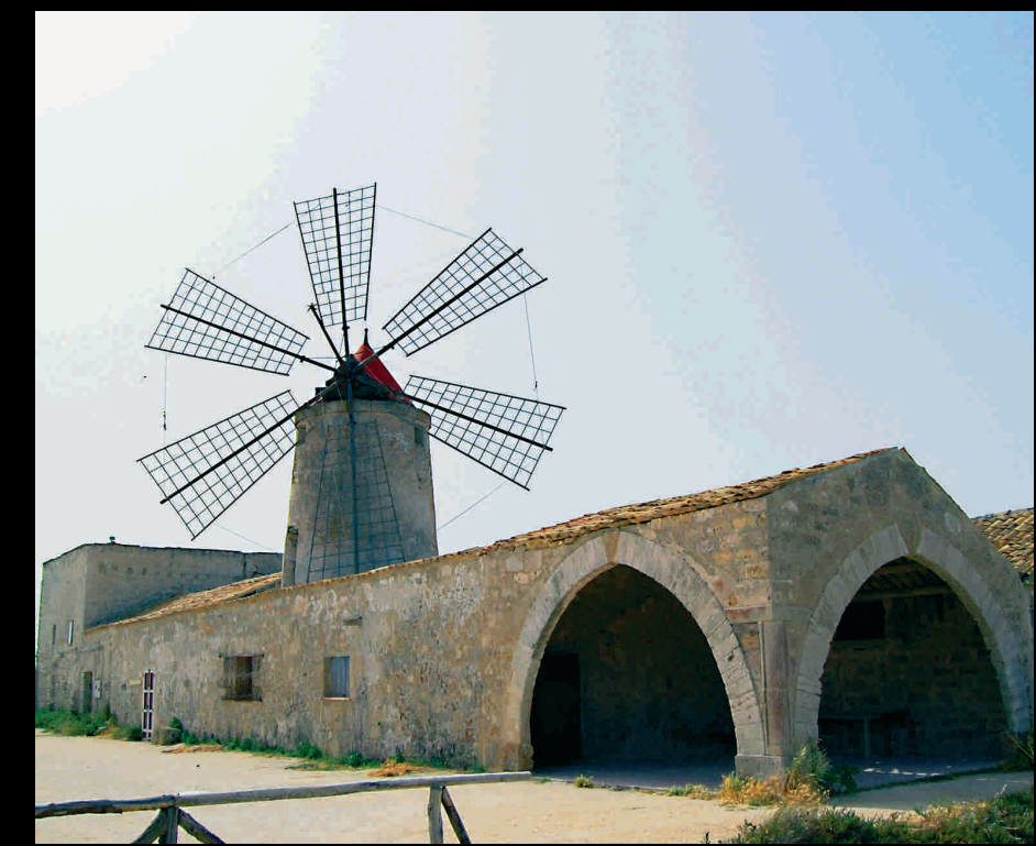
Mulino Maria Stella - Mühle Maria Stella

Torre di Nubia Del secolo XVI, ristrutturata nel 1585, faceva parte del sistema difensivo costiero Turm von Nubia Aus dem 16. Jh., 1585 umgebaut, gehörte zu dem Küstenverteidigungssystem