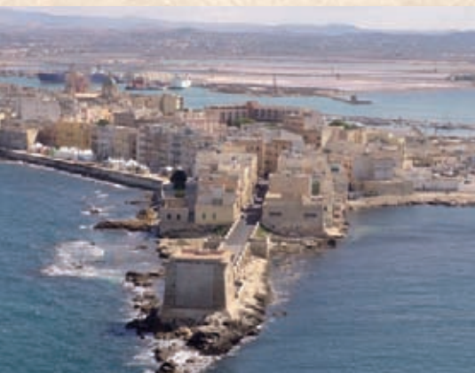
Trapani: Foto panoramica