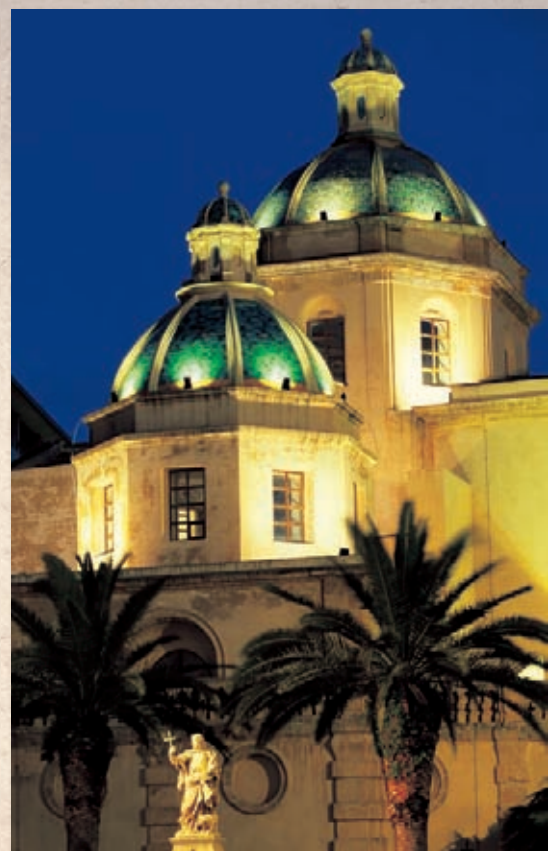
Mazara del Vallo: Le cupole della Cattedrale XI sec.