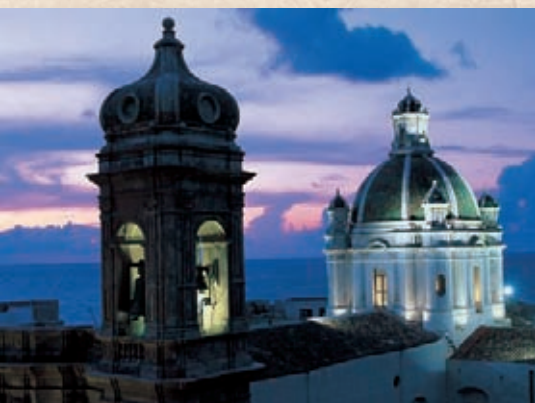
Trapani: Cattedrale dedicata a San Lorenzo, XIV secolo