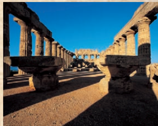
Selinunte: Parco archeologico Tempio E - V secolo a.C.