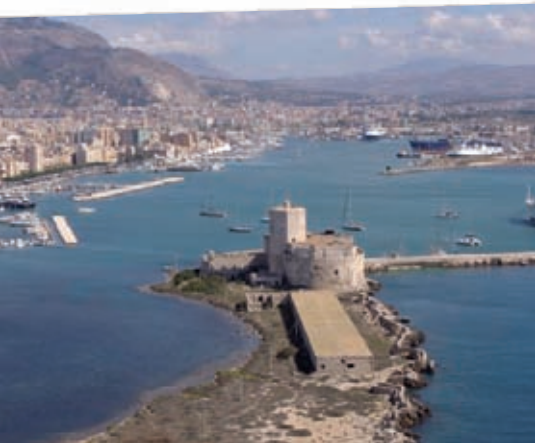
Trapani: Foto panoramica