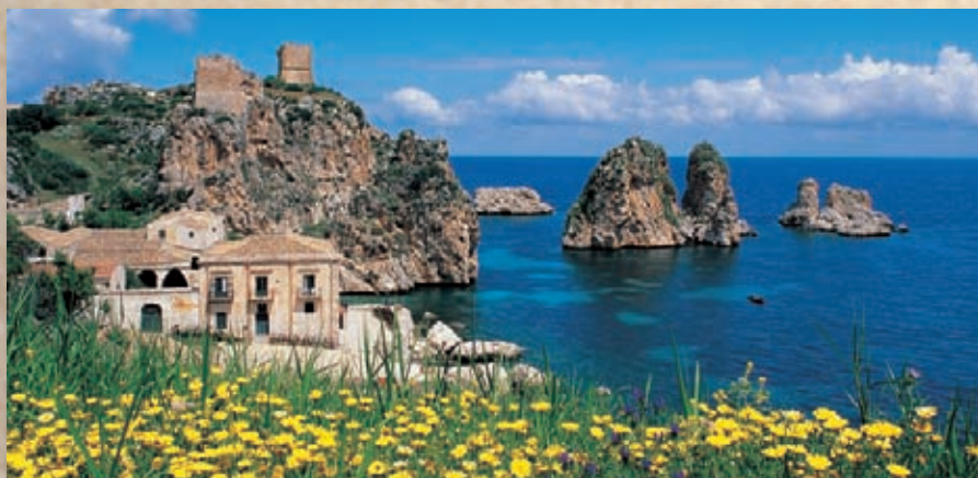
Scopello: La tonnara ed i faraglioni