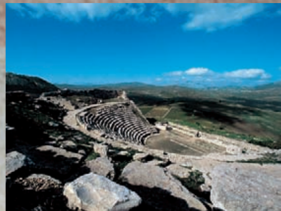
Segesta: Teatro ellenistico sulla vetta del Monte Barbaro

In addition to the capital, other important towns of the province are: Marsala, known especially for its wine tradition, Mazara del Vallo the hub of fishing and of the fish economy. San Vito lo Capo, Castellammare del Golfo, Erice and Alcamo for their tourist appeal, due to the natural beauty and the artistic-historic heritage. There are also many places full of art and archaeology: Selinunte, Segesta, Mozia and the Arab-Norman architecture of Mazara, Castelvetrano and Salemi.