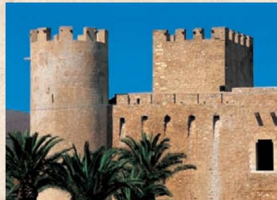
Alcamo: Castello dei Conti di Modica XIV sec.