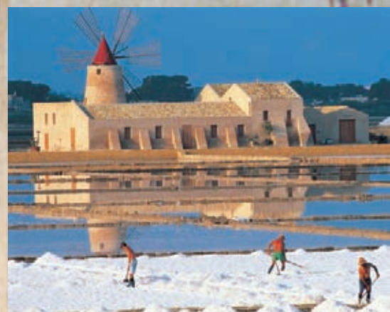
Marsala: Riserva Naturale dello Stagnone, salina Infersa - raccolta del sale