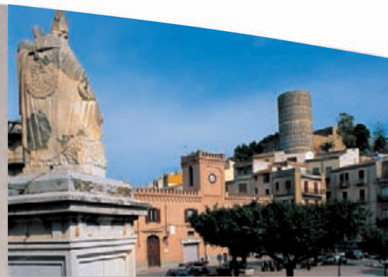
Salemi: Piazza Libertà e sullo sfondo il Castello Normanno del XIII sec.