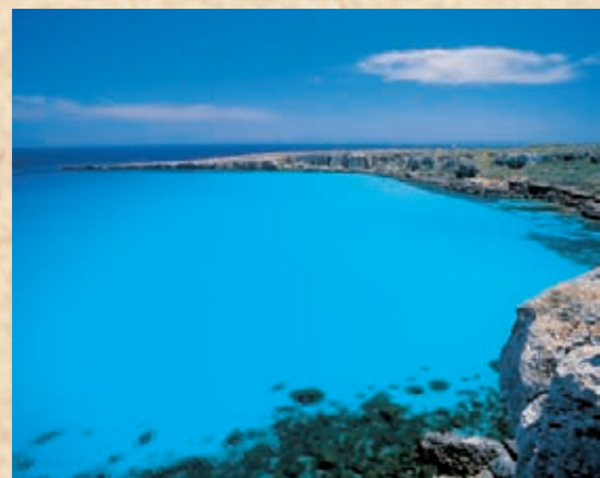
Isole Egadi: Favignana, Cala rossa