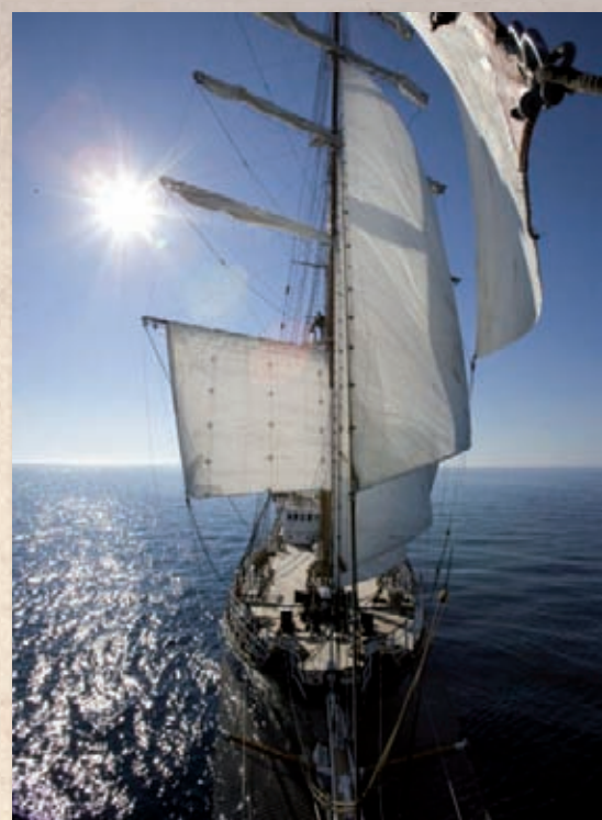
Signora del vento