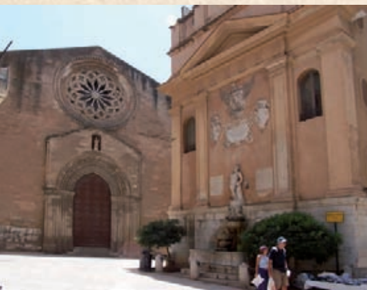
Trapani: Piazza Saturno (pb. L. Rallo)